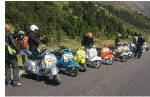
Tre Giorni in Innsbruck