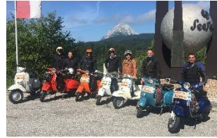
Sommertour an den Gardasee