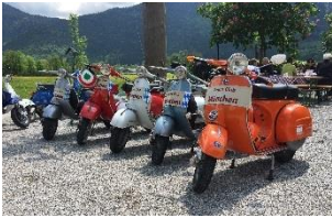
Anrollern im Frühjahr 2017